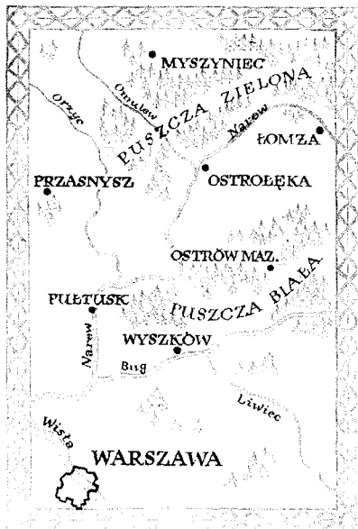
Rysunek 2. Schematyczna mapa puszczy Kurpiowskiej z podziałem na Zieloną i Białą.

kierunku Warszawy. Nasz wspólny region szybciej odwiedzą mieszkańcy innych miast z woj. mazowieckiego (łącznie z całkiem blisko położoną Warszawą), niż mieszkańcy Olsztyna czy Białegostoku. Jeśli Kurpie mają być bramą na Mazury, to otworzymy ją szerzej i zrobimy wszystko, aby turyści zostali u nas lub chociaż częściej nas odwiedzali na krótkie weekendowe pobyty.