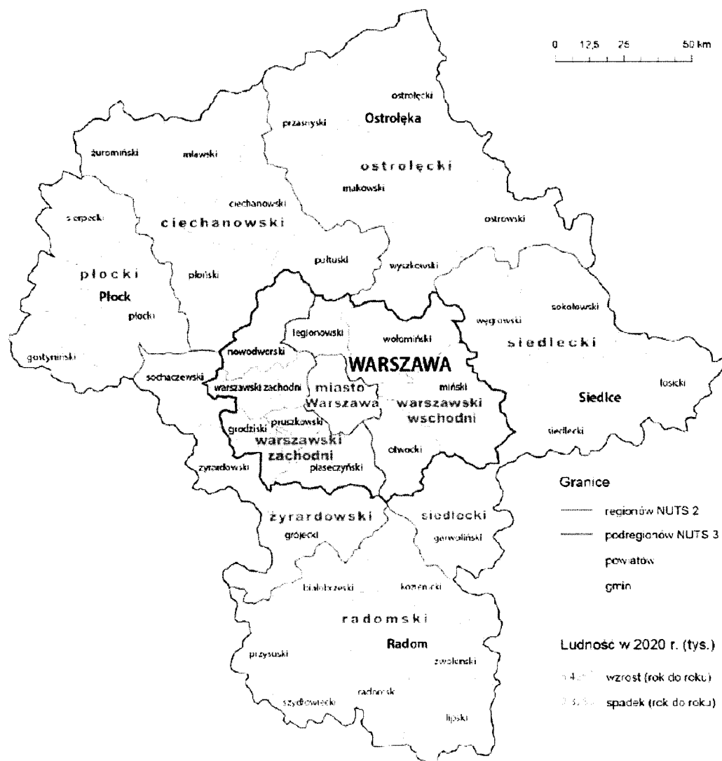
Rysunek 1. Podział administracji i statystyczny województwa mazowieckiego.

Zanim przejdziemy do kwestii finansowych i gospodarczych, chcemy powołać się na położenie gminy wiejskiej Przasnysz jako zachodniej części Kurpiowszczyzny. Poniżej prezentujemy historyczny, pochodzący z lat 50., szkic granic Kurpiów oraz szkic funkcjonujący obecnie w mediach społecznościowych. Teren gminy wiejskiej Przasnysz znajduje się na obu mapach. Zarówno w połowie XX wieku, gdy podział regionalny był bardzo silny, jak i obecnie, gdy w XXI wieku chcemy ponownie kultywować tradycje regionalne, teren obejmujący gminę wiejską Przasnysz był na Kurpiach. Co prawda bliżej centrum Mazowsza, ale to raczej otwiera region, a nie zamyka. W strategii województwa mazowieckiego i ponadregionalnej liczymy na turystów i zainteresowanie regionem – ale szybciej to nastąpi w kierunku od centrum i z południa województwa, a nie z Mazur w